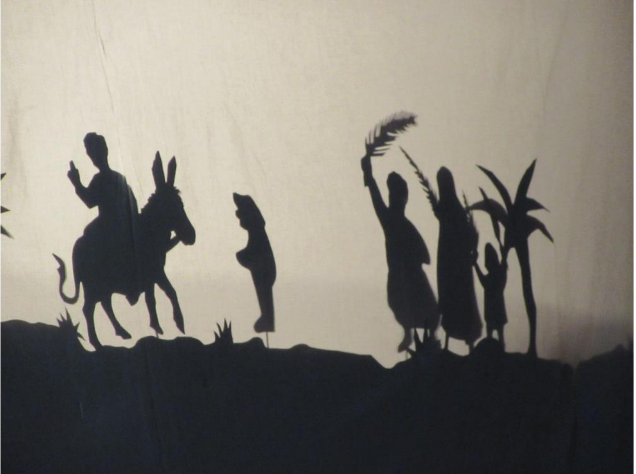
Schattenspiel am Palmsonntag: Einzug von Jesus in Jerusalem